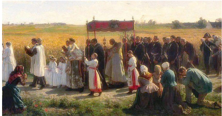
Bénédition des blés en Artois, peinte par Jules Breton en 1857, Musée des Beaux-Arts, Arras.

Le rite des rogations est ancien : il a été institué au 4 e siècle par saint Mamert, alors évêque de Vienne en Gaule. Ce sont des prières et des processions dans les champs, afin de demander à Dieu que s'éloignent les calamités et que les récoltes soient bonnes. A cette occasion, le prêtre bénit les fermes, les cultures et les troupeaux. Pour le paysan, c'est un acte de confiance en Dieu. Ces rogations se déroulent normalement sur les trois jours avant le jeudi de l'Ascension. Si ce rite est tombé en désuétude ces dernières décennies, il revient peu à peu depuis quelques années.