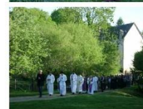
Rogations dans le Morbihan, bénédiction par Mgr Centène.