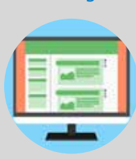
Visibilité sur le site DDEC 56

Préparez le contenu de vos supports de communication et envoyez les informations suivantes à valence.lemaistre@e-c.bzh :