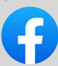
Publication sur les réseaux sociaux Fb, X, In, Lk