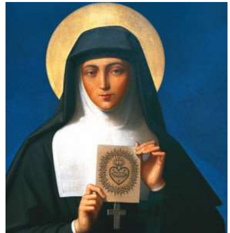
Sainte Marguerite-Marie Alacoque

Paray-le-Monial, lieu des apparitions à Sainte Marguerite-Marie Alacoque, est devenu un grand lieu de pèlerinage en France avec le passage de 200 000 personnes chaque année. Ces pèlerins sont en quête le plus souvent de l'amour de Dieu, car, pour les chrétiens, il n'y a pas de plus grand bonheur que celui de se sentir aimé de Dieu.