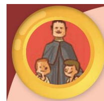
Saint Jean Bosco

C'est le même Esprit, reçu par les apôtres, qui a parlé autrefois par les prophètes et qui anime aujourd'hui la vie de l'Église. Avec le récit de la transmission du manteau d'Élie à d'Élisée, les enfants découvriront l'importance de ce qu'ils reçoivent des générations antérieures. Ils verront que par le don de l'Esprit, chaque baptisé devient capable de vivre de l'amour de Dieu et d'annoncer la Bonne Nouvelle. Chacun est ainsi appelé à se laisser transformer et à devenir disciple-missionnaire afin de porter du fruit à son tour.